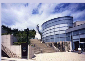
< 岡本太郎美術館 >

日本民家園、岡本太郎美術館、かわさき宙(そら)と緑の科学館、市民ミュージアムの入館料等の半券でアートセンターアルテリオ映像館鑑賞料も割引！