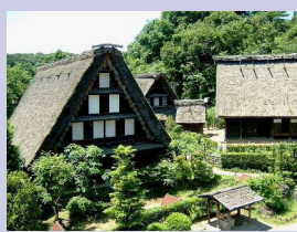
< 日本民家園 >