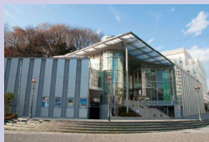
< アートセンター >