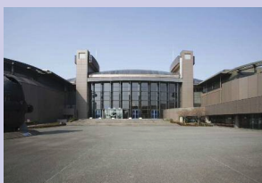
< 市民ミュージアム >