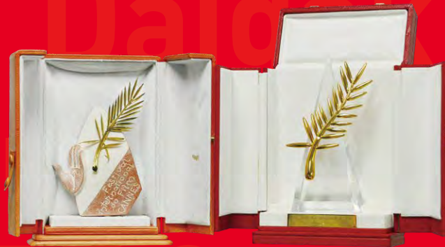
「檜山節考」『うなぎ』カンヌ国際映画祭パルムドール（川崎市アートセンター寄託）