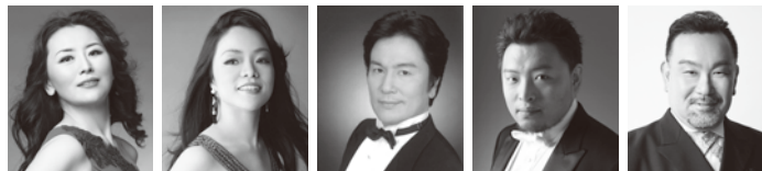
鳥木弥生 ©Yoshinobu Fukaya 但馬由香 ©Yoshinobu Fukaya 松浦 健 井出 司 豊嶋祐壺 ©Yoshinobu Fukaya