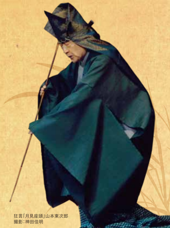
狂言「月見座頭」山本東次郎

チケットご購入のご案内 2月1日(金)より発売! 良いお席はお早めに。2/2(土)、2/3(日) 営業