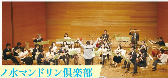
御茶ノ水マンドリン倶楽部