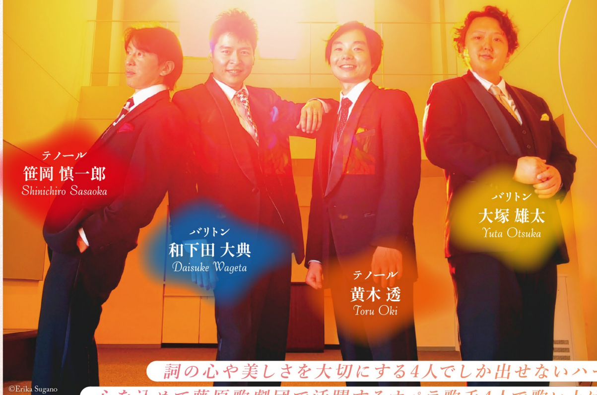
テノール 笹岡 慎一郎 Shimichiro Sasaoka

2024. 5/6 (月・振) 14:00 開演 (13:30開場) [会場] 昭和音楽大学ユリホール (小田急線「新百合ヶ丘」駅南口から徒歩4分)